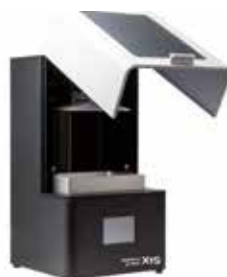
Organical® 3D Print X1S

Der 3D Drucker Organical® 3D Print X1S bspw. ermöglicht neben allen klassischen dentalen Anwendungen den 3D Druck von patientenspezifischen, indirekten Bonding Trays für ein schnelles und passgenaues Anbringen kieferorthopädischen Brackets bei Zahnspangen. Die Transferschienen lassen sich anschließend bequem entfernen. Abhängig von der Größe der flexiblen Bonding Trays können Sie auf dem 3D Drucker bis zu vier Transferschienen in nur 40 Minuten drucken. Ihre Set up Modelle drucken Sie nicht weniger schnell. Die reinen Materialkosten belaufen sich abhängig von der Resinwahl auf ca. 1,00-1,50 € je Set up Modell.