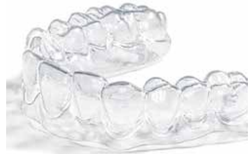
Organical® Aligner Therapie

Medizinisch, ethisch, wirtschaftlich – wir unterstützen Sie von Anfang an